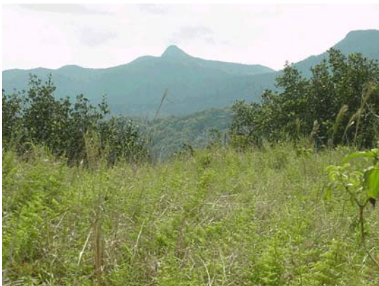
Pico El Toro (3,524 pies de altura)

Luis Fortuño, Comisionado Residente de Puerto Rico en Washington, endosó la Ley del 2005 del Bosque Nacional del Caribe que fue firmada por el Presidente Bush el 1 de diciembre de 2005.