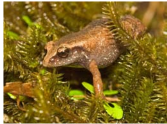
Coquí Duende, ( Eleutherodactylus unicolor )

Localizada a 25 millas al este de San Juan, en la cara oeste de la Sierra de Luquillo, el área es nombrada por el pico más alto del