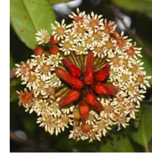
Bejuco de Rana, ( Marcgravia sintenisii )

En el bosque también se encuentran 240 especies de árboles nativos – muchos más que en cualquier otro bosque nacional. En el bosque crecen plantas