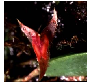
Orquídea en Miniatura, ( Lepanthes eltoroensis )

Una designación como área silvestre bajo la Ley de Áreas Silvestres de 1964 es la mayor protección que se puede otorgar a las áreas