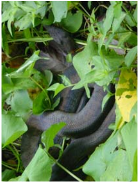
Boa de Puerto Rico, ( Epicrates inornatus )