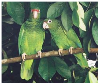
Cotorra Puertorriqueña, ( Amazona vittata )

La Ley del 2005 del Bosque Nacional del Caribe designó cerca de 10,000 cuerdas del Bosque Nacional El Yunque y de la Reserva Experimental de Luquillo como un área silvestre, más de un tercio de las 28,000 cuerdas totales del bosque.