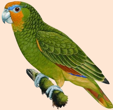
cotorra de cresta anaranjada

Existen 352 especies de cotorras en el mundo. Estas son algunas de las aves exóticas que hay en Puerto Rico que comúnmente se confunden con la puertorriqueña. Existen otras.