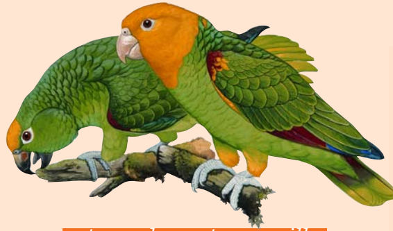
cotorra de cresta amarilla